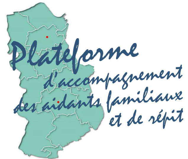
BERNAY & PONT-AUDEMER